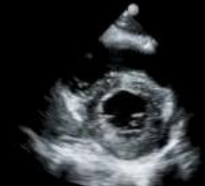
Linker Ventrikel, kurze Achse

©2017 Koninklijke Philips N.V. Alle Rechte vorbehalten. Philips behält sich das Recht vor, ein Produkt zu verändern und dessen Herstellung jederzeit und ohne Ankündigung einzustellen. Marken sind das Eigentum von Koninklijke Philips N.V. oder der jeweiligen Inhaber.