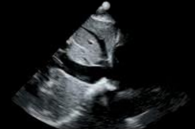
Vena cava inferior